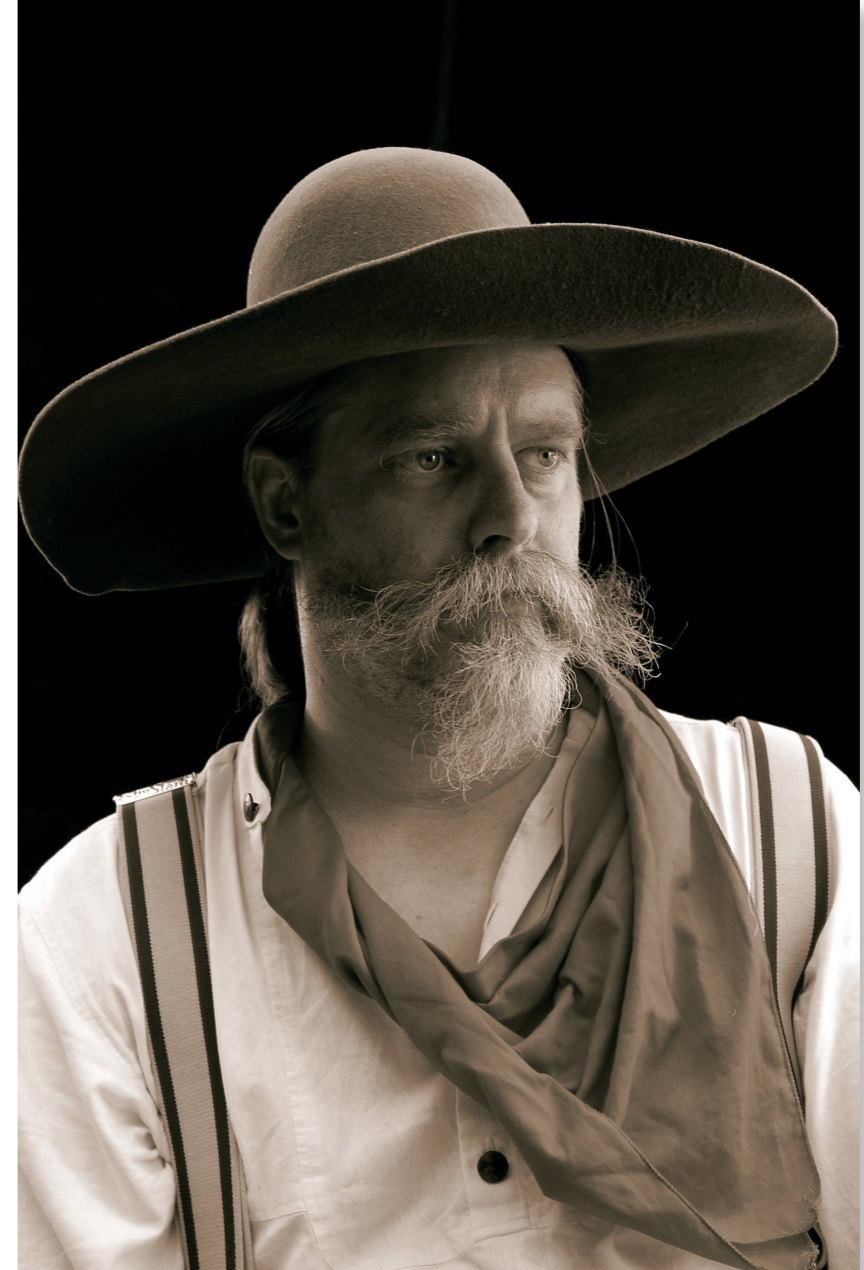
Fotografie Alle 5 Abbildungen: 70 x 100 cm 2005