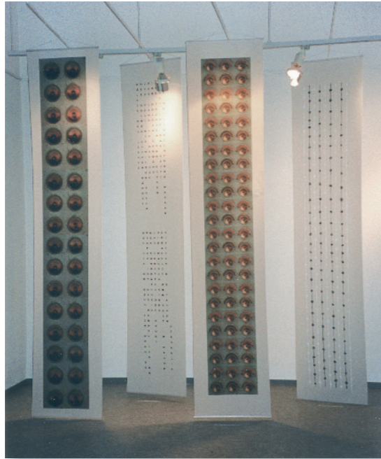
Fahneninstallation zum Hölderlin-Gedicht „Hälfte des Lebens“ Druck und Zeichnung auf transparenter Plotterfolie 4 Teile, je 75 x 300 cm 1996