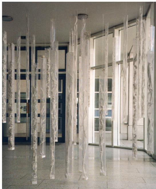
„Hirn- und andere Gespinste“ Papier in Plexibehälter 32-teilig, verschiedene Größen 1997