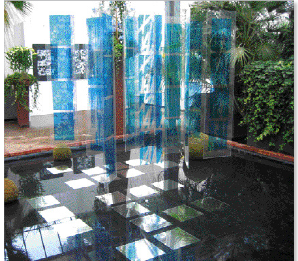
„Blaue Gespinste“ Installation, Fotodruck auf Plexiglas 20-teilig, je 30 x 130 cm 2003